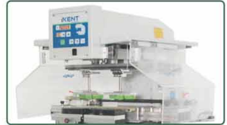
两旁安全感应滑动机翼