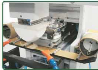
自动清洁胶头装置