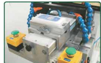
印刷产品自动推送位置