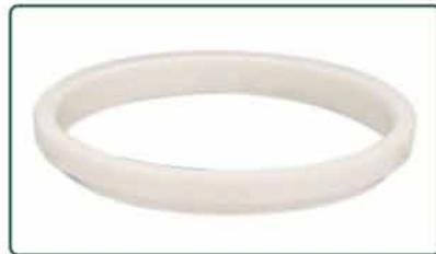
高密度坚硬耐用油杯陶瓷环

全球及国内环保意识受到重视，落伍的油盘已被油杯系统取代。密封油杯是最佳的选择，同时亦顾及成本经济效益。