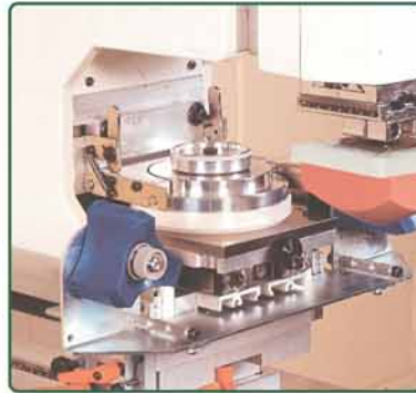
独立单色机（连清洁胶头系统）