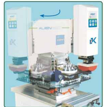
可转90度平台，易于胶头及钢片安装