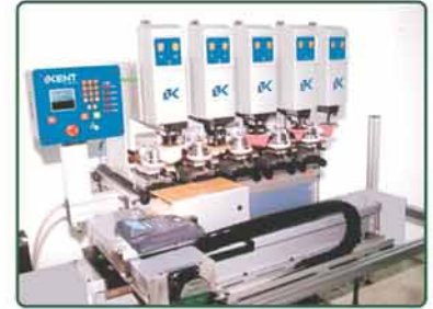
生产线上连动多色Alien机